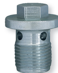
Art. 109727 (Alfa Romeo / Chrysler / Fiat / Jeep / Lancia / Opel / Vauxhall / Saab)