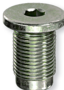
Art. 5439 (Alfa Romeo / Fiat / Lancia)